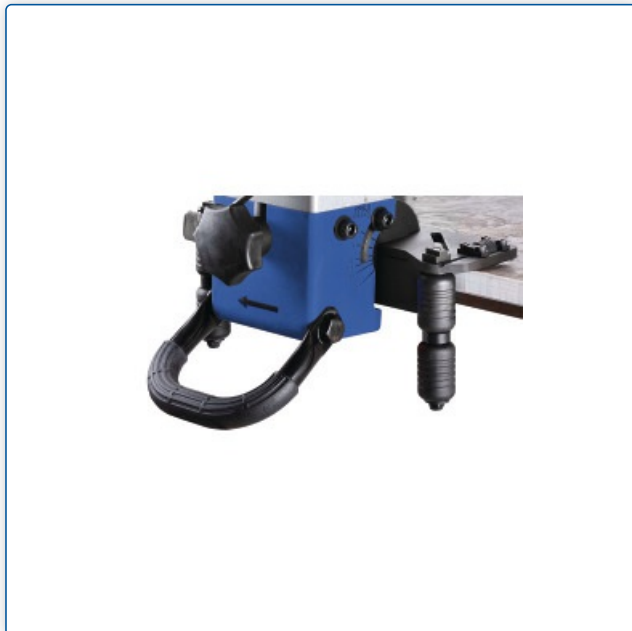
KE 16-2 z zamontowanym uchwytem