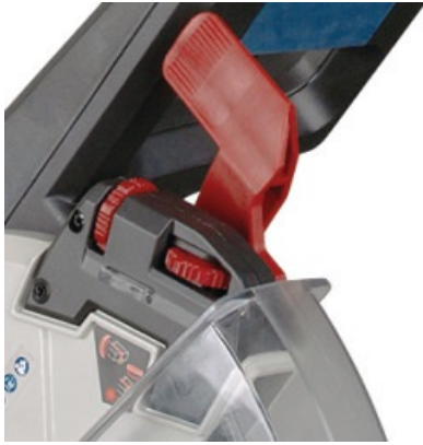
Standardowo z laserem