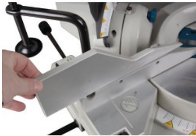
Wysuwane szyny systemowe