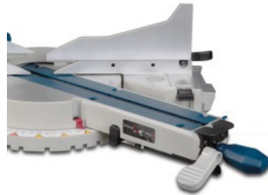
Wygodna regulacja kąta nachylenia i pochylenia głowicy bezpośrednio z przodu stołu