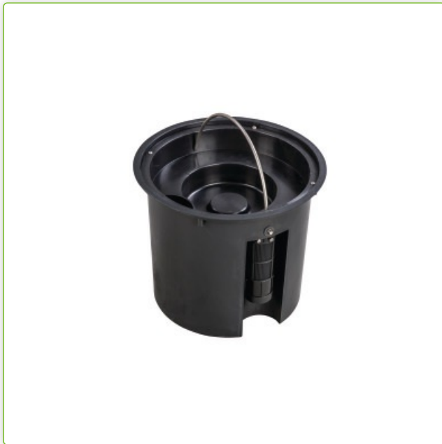
Zbiornik na detergent ułatwiający napełnianie i czyszczenie